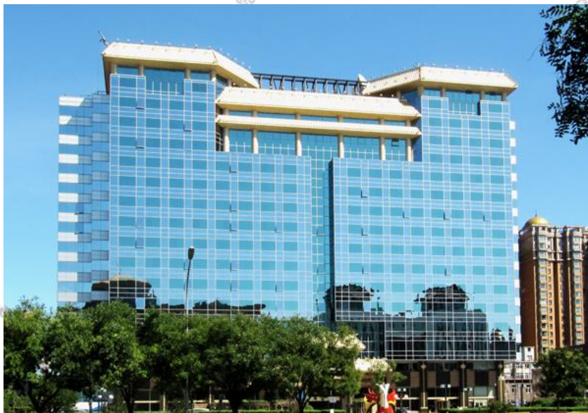
（DA 办学地点：北京光华长安大厦）

我们的使命是“帮助中国的知识工作者学习和实践德鲁克的学说”。自创办伊始，学院就始终致力于德鲁克管理思想的研究与传播，是国内公认的较具影响力的德鲁克管理思想传播及德鲁克管理课程提供的专业学院。学院类型为民办非学历高等教育机构，培训对象是在职的企业管理者，培训教学形式为面授，并同时开设远程课程予以辅助。