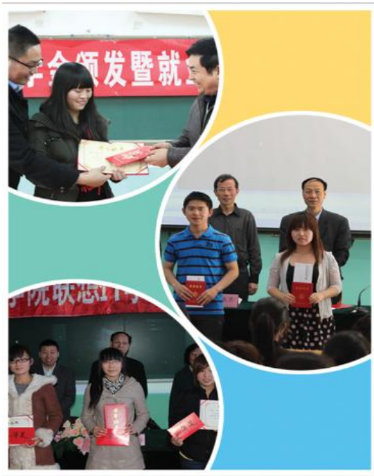
院领导与校企合作单位负责人为获奖学生颁奖